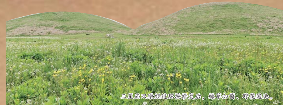
三星庙双墩墩周边环境修复后，绿草如茵，环境幽雅。

穿越村庄一路向西南，不时可见成双的土墩静静地矗立在田间深处，每处皆有围栏保护。走进一片桃林掩盖后方，两座绿草葱郁的土墩在野花铺满的青绿中并列着。这就是三星庙墩王陵，也是六安汉代王陵墓地保存最为完整、体量最大的一对陵墓。