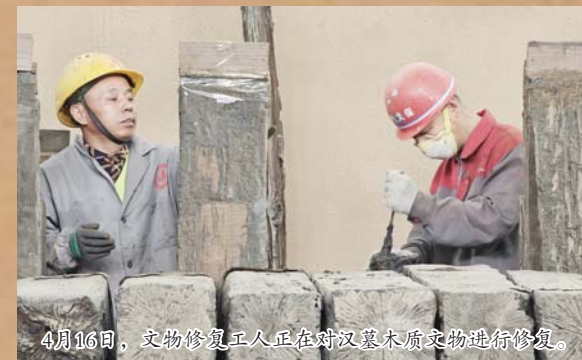
4月16日，文物修复工人正在对汉墓木质文物进行修复。