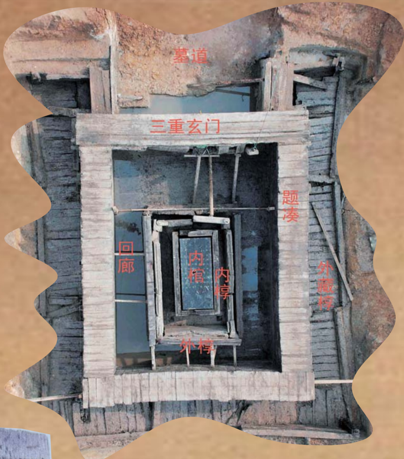
「黄肠题凑」主要部位结构示意图