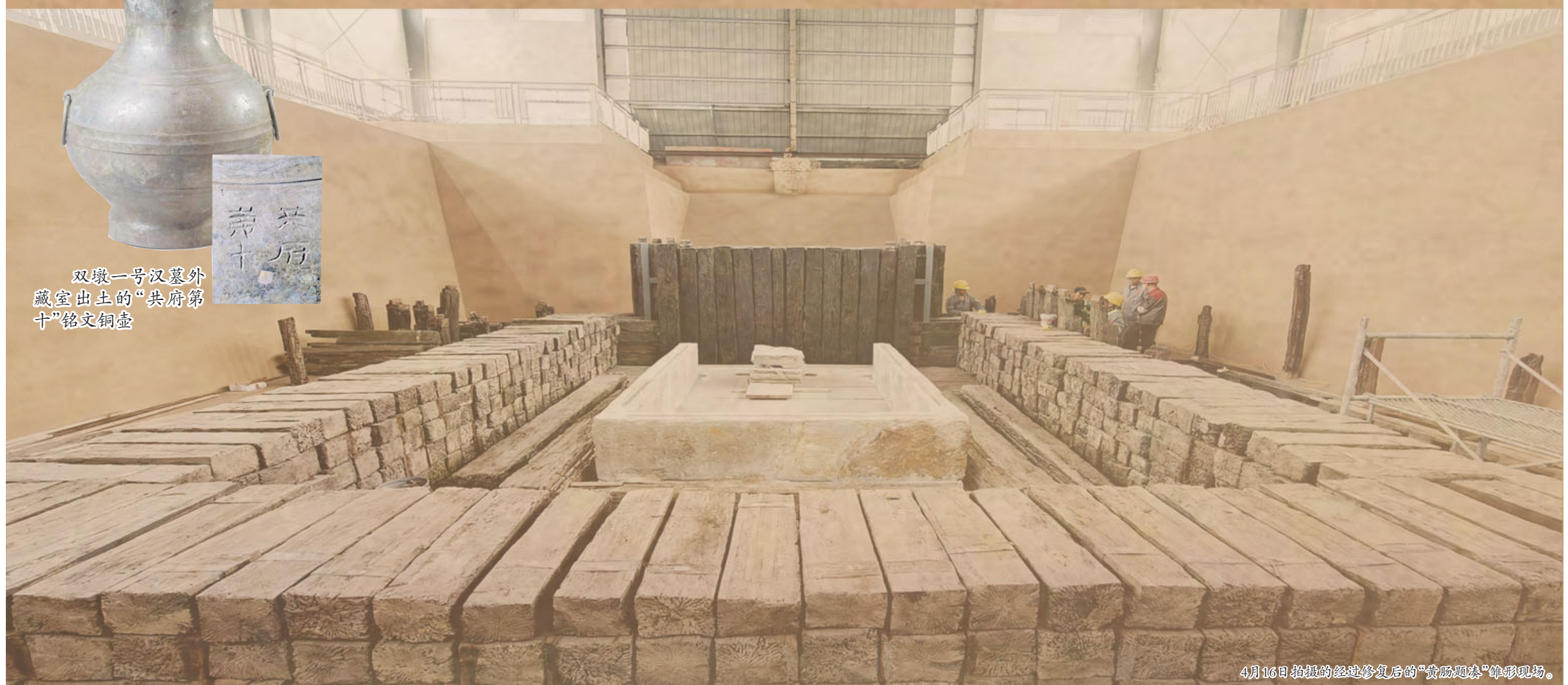
4月16日拍摄的经过修复后的“黄肠题凑”葬制现场。