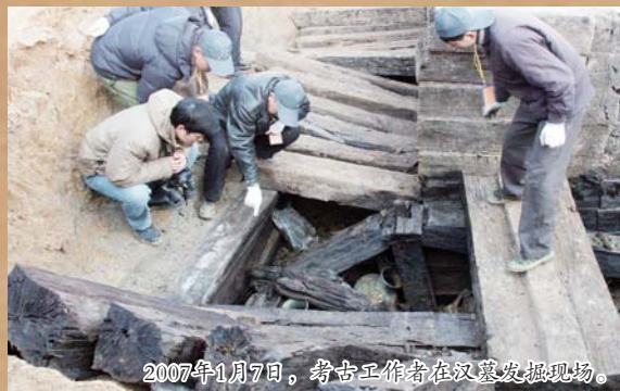
2007年1月7日，考古工作者在汉墓发掘现场。