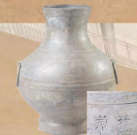
双墩一号汉墓外藏室出土的“共府第十”铭文铜壶