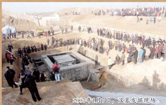
2007年1月7日，汉墓发掘现场。