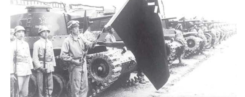
1949年8月1日，中国人民解放军隆重举行建军22周年纪念活动。图为军旗照耀下的人民担充部队。

建军节后，中央苏区还开展了文艺演出、军事体育竞赛等庆祝活动。7月30日，工农剧社举办了“八一”纪念晚会，毛泽东出席晚会并向群众讲述了工农红军的革命历史。晚会中，有唱歌跳舞表演，并演出了活报剧《谁的罪恶》、话剧《南昌暴动》等